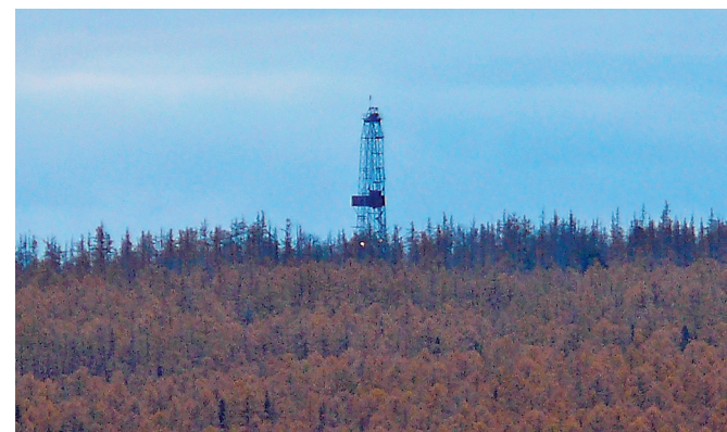
Буровая установка на Юрубчено-Тохомском месторождении

Осуществляя перевооружение производства, наращивая объемы буровых работ и расширяя географию деятельности, экспедиция активно развивается и укрепляет свои позиции на рынке сервисных услуг. В основе этих достижений лежит добросовестный и ответственный труд геологов – настоящих профессионалов своего дела, которые всегда находятся на переднем крае нефтедобычи.