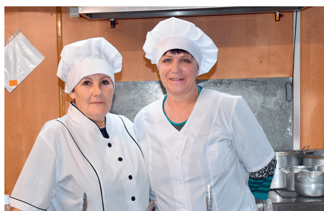
Повара столовой вахтового поселка ООО «БНГРЭ»

Создавая комфортные бытовые условия для своих работников, ООО «БНГРЭ» успешно реализует долгосрочную стратегию развития, заботясь о том, чтобы вахтовики вдали от родной земли чувствовали себя как дома.