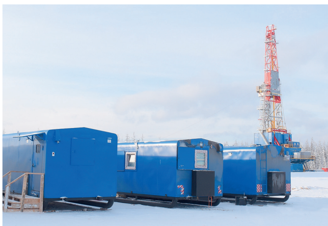
Вахтовый поселок на Куюмбинском месторождении

Сегодня работа в ООО «БНГРЭ» привлекает большое количество специалистов из разных регионов страны, и эффективная деятельность предприятия по улучшению условий труда и отдыха работников является надежной гарантией его дальнейшего развития.