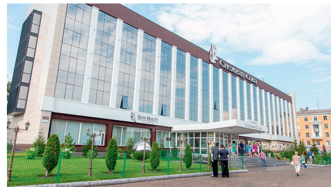
Отель «Снежная сова», г. Красноярск

В настоящее время на отдаленных производственных объектах ООО «БНГРЭ» создаются круглосуточные фельдшерские пункты для оказания квалифицированной медицинской помощи работникам экспедиции и подрядных организаций. В вахтовых поселках на