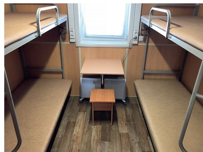
Жилой вагон-дом вахтового поселка ООО «БНГРЭ»