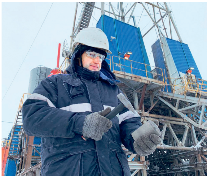
Изучение керна на Тагульском лицензионном участке

В основе производственных достижений Байkitской нефтегазоразведочной экспедиции лежит добросовестный и ответственный труд геологов – настоящих профессионалов своего дела, которые всегда находятся на переднем крае нефтедобычи.