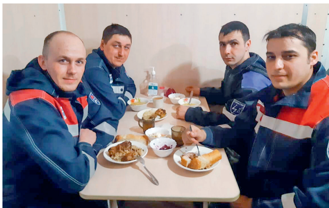
Работники ООО «БНГРЭ» на обеде

Столовые вахтовых поселков Байkitской нефтегазоразведочной экспедиции предлагают широкий ассортимент вкусных и питательных блюд.